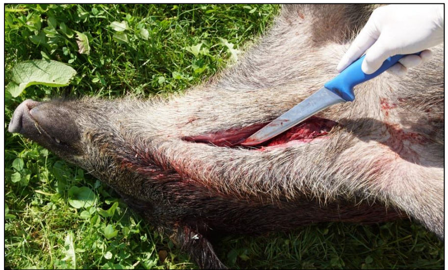
Abb. 2: Eröffnung der Halsvene mittels Längsschnitt zur Blutprobenentnahme